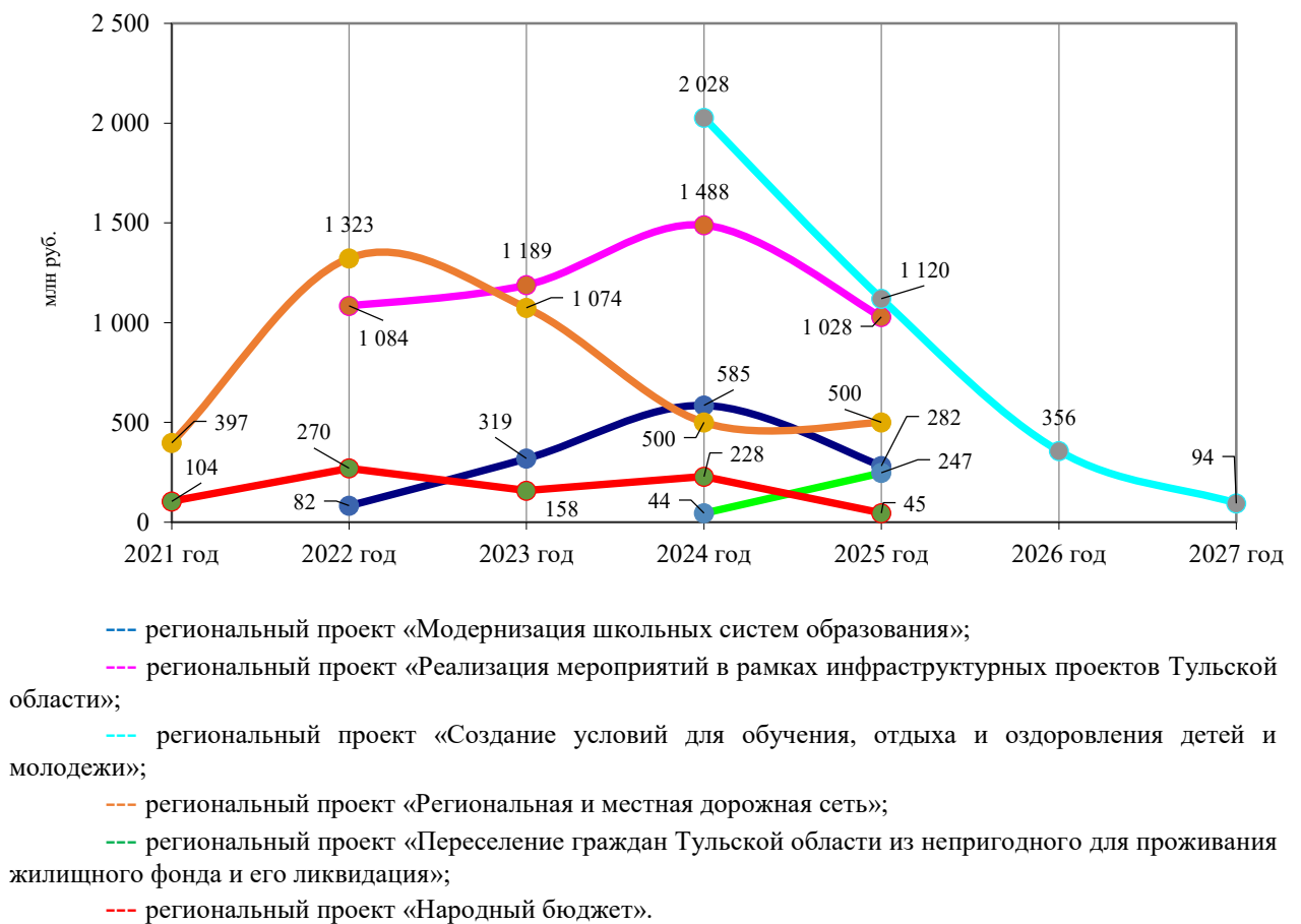
Диаграмма 1. Региональные проекты с годовым объемом финансирования свыше 100 млн руб.

Динамика объемов финансирования региональных проектов в период реализации 2021-2023 гг. (по фактическому исполнению), 2024 г. (по оценке ожидаемого исполнения), и по плановым назначениям на 2025-2027 гг. в соответствии с проектом Решения о бюджете, характеризуется данными следующих диаграмм.